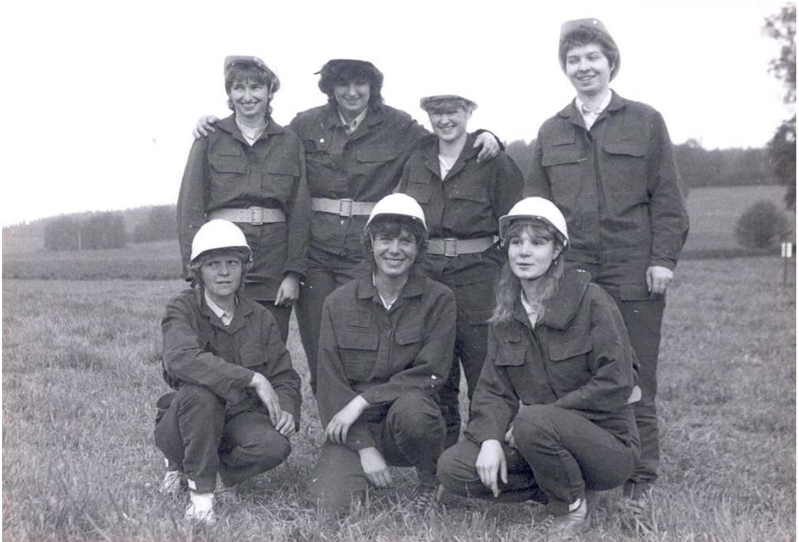
Vítězné družstvo žen Okrsková soutěž v Janovicích 1989 (čas 32,74)