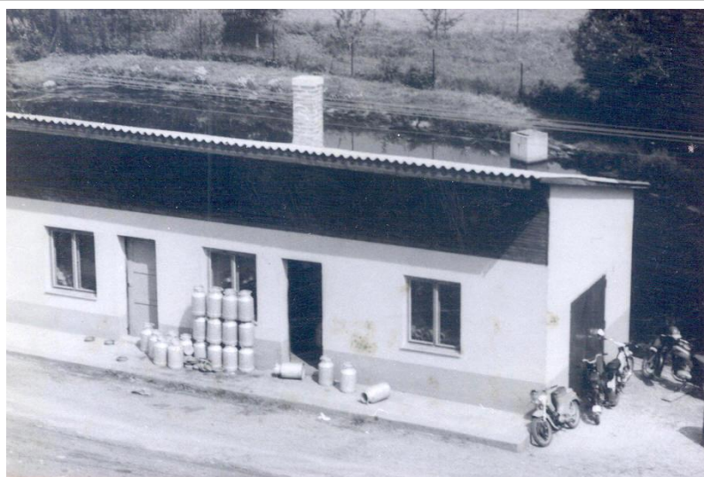
Nová zbrojnice a sběrna mléka