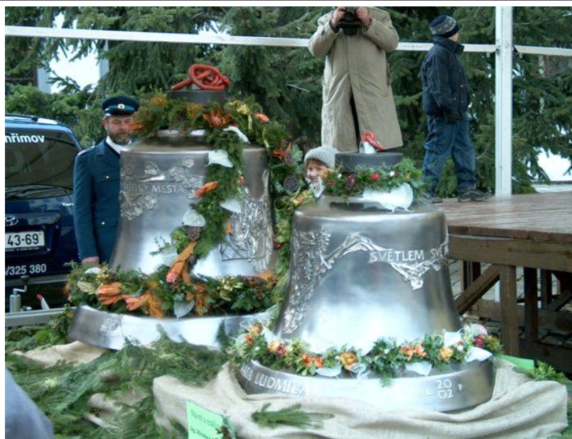
Nové zvony . Pelhřimov 2004