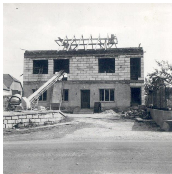
Před dokončením hrubé stavby