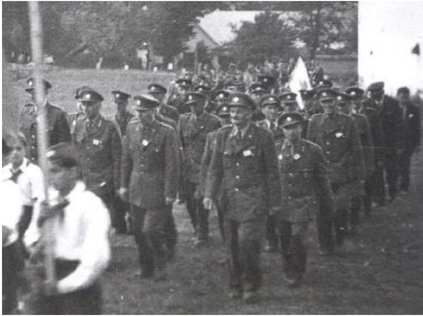
Nejvyšší představitelé okresního srazu