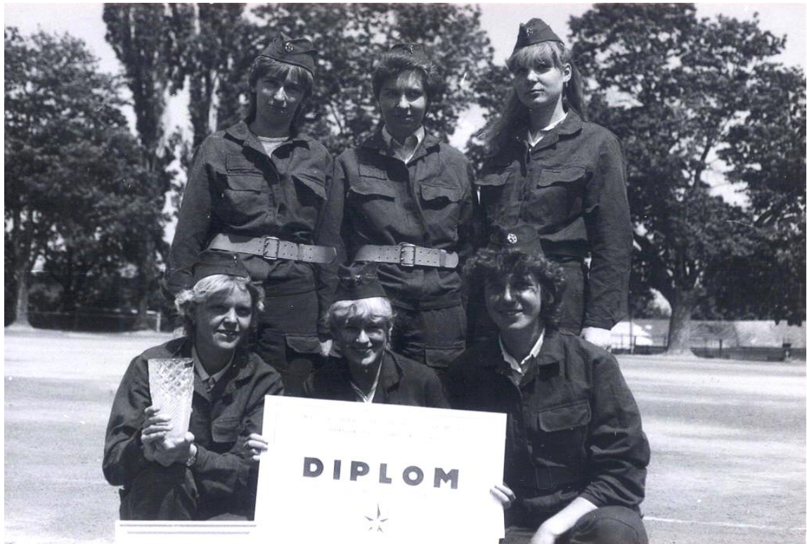
Vítězné družstvo žen 1989 Pelhřimov. Soutěž o putovní pohár předsedy MěNV Pelhřimov.