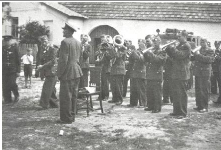
Kapela ze Žďáru nad Sázavou na návsi v Janovicích vítá příjezdějící sbory 5.7.1953