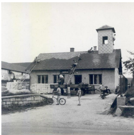
Přestavba původní zbrojnice na prodejnu a společenskou místnost