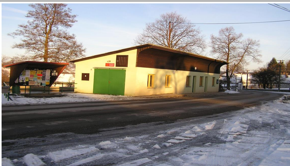
Zbrojnice po přístavbě a celkové rekonstrukci – únor 2005