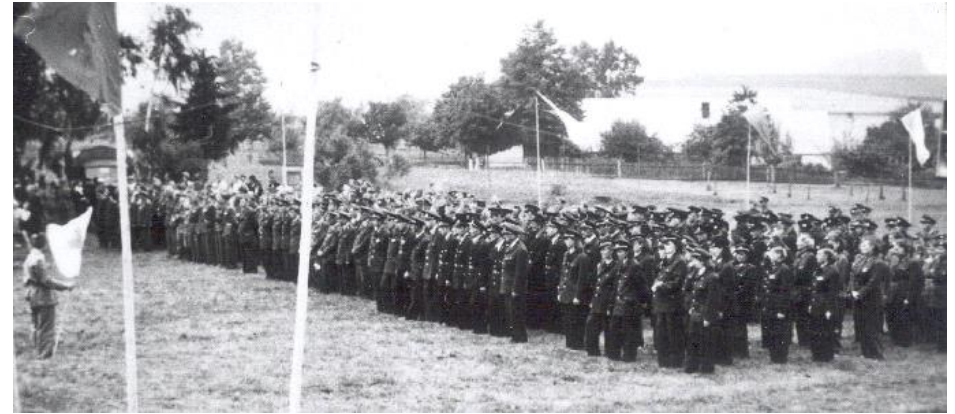
Slavnostní nástup hasičských družstev v Janovicích za Štěpánovi 5.července 1953 Zúčastnilo se 46 sborů : Žďár nad Sázavou, Nové město na Moravě, Jihlava, Zruč nad Sázavou, Světlá nad Sázavou, Ledeč nad Sázavou, Havlíčkův Brod, Pelhřimov, Žirovnice, Nová Včelnice, Počátky, Nový Rychnov, Košetice, Sázava, Myslotín, Nová Buková, Josefodol, Pavlovice, Bernartice, Radňov, Vyskytná, Jaroměřice nad Rokytnou Štoky u Jihlavy, Vílanec, Bedřichov u Jihlavy, Červená Řečice, Dolní Město, Nová Cerekev, Dolní Cerekev, Rynárec Zajíčkov, Strměchy, Olešná, Popelištná